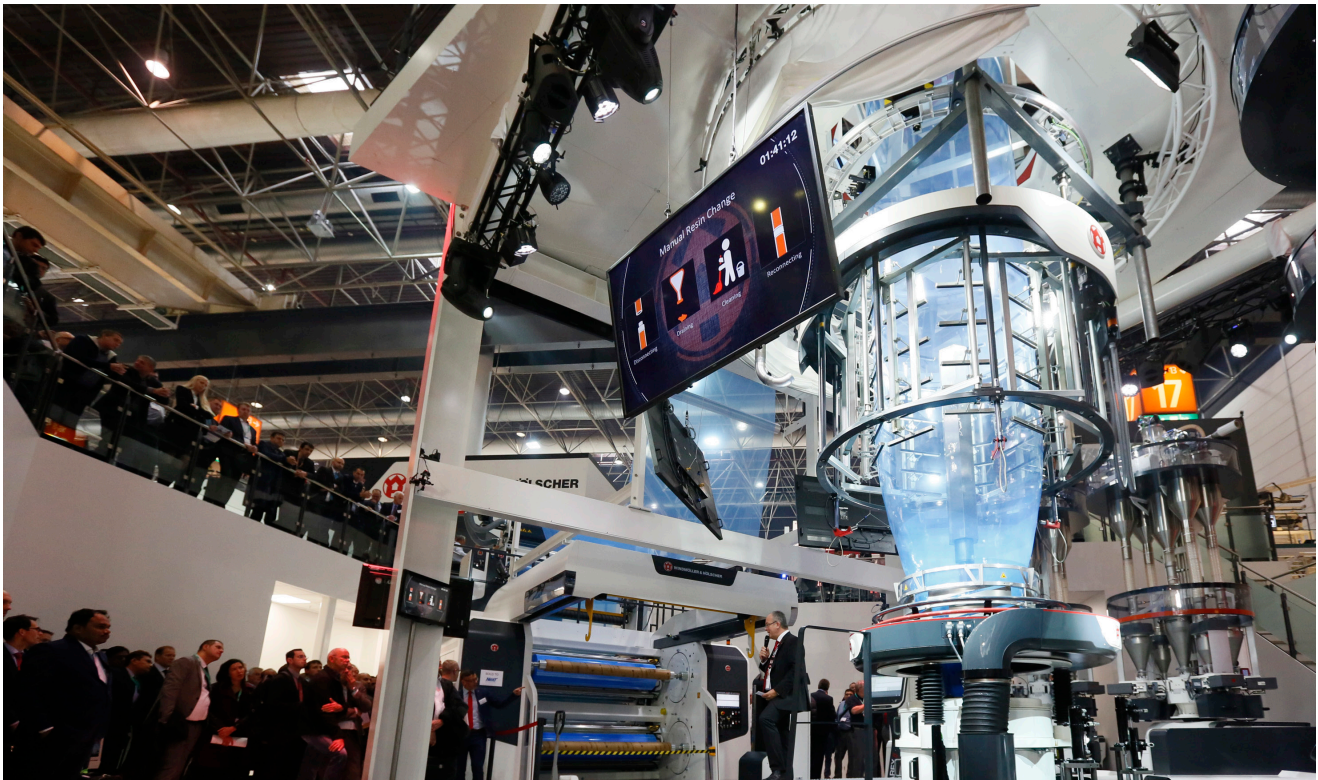
К 2016, Източник: Messe Düsseldorf, Constanze Tillmann.

3. Интеграция на системата: Функционалност чрез материали, процес и дизайн: в рамките на тази тема се обобщават отделните области на новите материали и производството на добавки, олекотените конструкции, мобилността (е-мобилността) и био пластмасите.