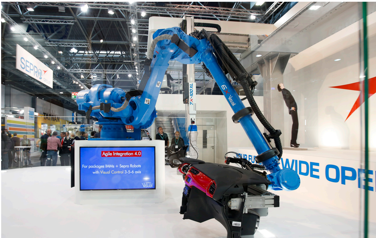
К 2016, Източник: Messe Düsseldorf, Constanze Tillmann.

К е барометър за производителността на индустрията и нейния глобален пазар за иновации. Това е мястото, където експертите от цял свят се събират, за да демонстрират работата на своята индустрия и да покажат актуални и визионерски приложения на пластмаса и каучук на професионалисти от автомобилната, опаковъчната, електротехническата, медицинската и аерокосмическата индустрия, от областта на електрониката и комуникациите, строителството и др.