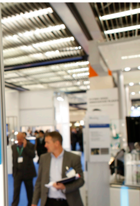
К 2016, Източник: Messe Düsseldorf, Constanze Tillmann.